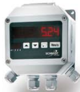
Affichage DEL sur boîtier mural

Les capteurs de flux de SCHMIDT Technology vous permettent d'atteindre une efficacité énergétique maximale, de maîtriser les valeurs de mesure et de garantir en permanence un fonctionnement optimal. Le montage simple et rapide des capteurs sur le conduit est efficace : percer un trou, fixer le capteur au moyen d'une bride de montage, effectuer le branchement électrique- et c'est fini.