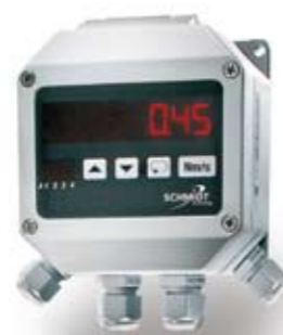
Affichage DEL sur boîtier mural

Nos capteurs de flux s'occupent de la détection sûre des flux d'air prédéfinis dans les normes diverses et de la mesure avec une faible consommation d'énergie du débit excessif d'une salle blanche à une autre. Pour ce qui est de la sécurité des personnes et de l'assurance qualité, vous profitez surtout de notre haute exigence de qualité. Bien entendu, chaque capteur est également disponible avec un certificat de calibrage ISO qui documente noir sur blanc la précision.