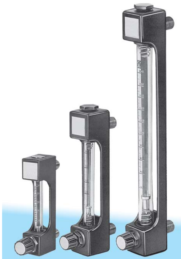
Figure 1 Débitmètre à flotteur F VA Minix