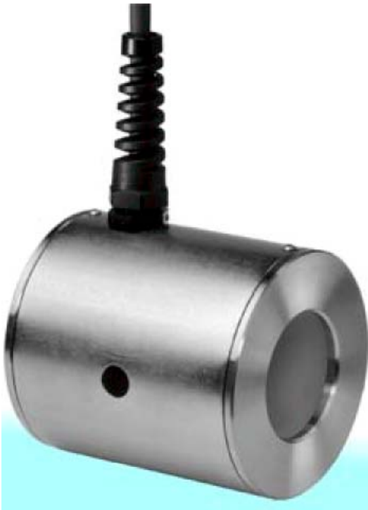
Figure 1 Capteur de débit magnéto-inductif mag-flux S