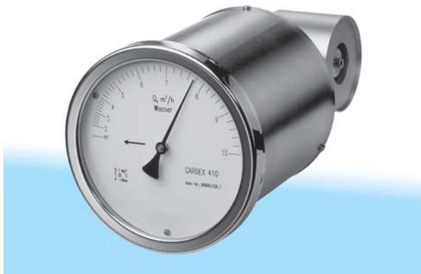
Fig. 1 Débitmètre F I Gardex