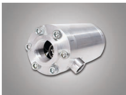
Version avec roulement à billes

Version avec roulement à billes: Version économique pour fluides graissants et pressions jusqu'à 250 bars.