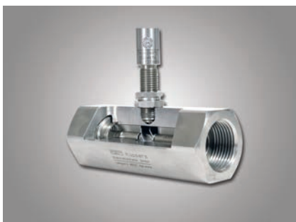
Raccord à vis

Raccord à vis: Version compacte pouvant être facilement intégré dans les tuyaux existants. La version standard supporte des pressions jusqu'à 630 bars tout comme les impuretés à gros grains. Des versions avec différents filetages intérieurs et extérieurs sont disponibles.