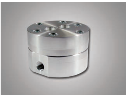
Version en aluminium

Version en aluminium: Débitmètre volumétrique économique pour les fluides graissants et pressions jusqu'à 300 bar. Idéal pour l'utilisation en hydraulique.