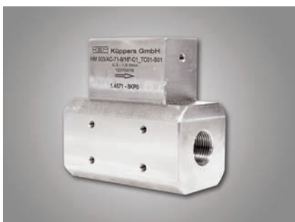
Version à haute pression

Version à haute pression: Ces turbines ont leur place avant tout dans les utilisations Off-Shore. Grâce à leur grande résistance à la pression jusqu'à 5.600 bars, elles peuvent être utilisées par exemple pour les installations de découpage au jet d'eau.