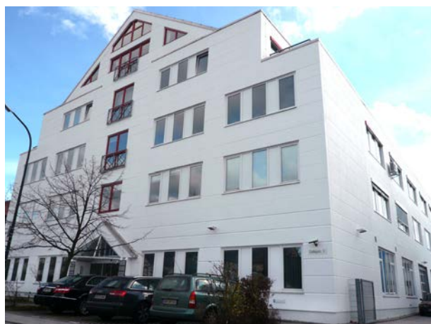
Centre de vente et de développement (Karlsfeld)