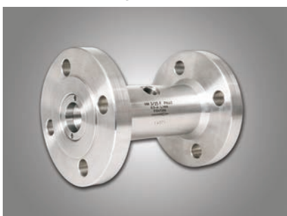
Version à montage à bride

Version à montage à bride: Pour l'utilisation avec des débits de 0,03 à 25.000 l/min, il est possible d'installer facilement des débitmètres à turbine à montage à bride. Les différentes variantes à montage à bride DIN, ANSI, RTJ et Tri-Clamp à différents degrés de pression font de la turbine à bride une installation polyvalente.