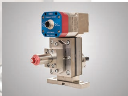
Dispense Control Device