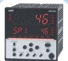
全色橙色表示モデルもご用意