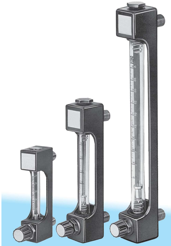
Figure 1 Débitmètre à flotteur F VA Minix